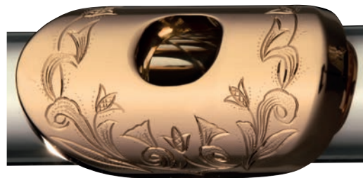
Gravur Typ A