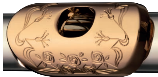
Gravur Typ B