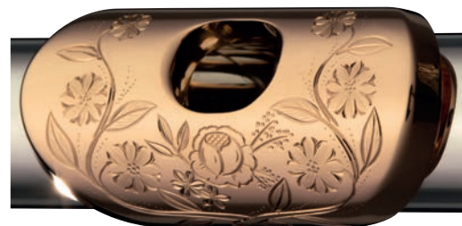
Gravur Typ C