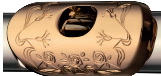
Gravur Typ B