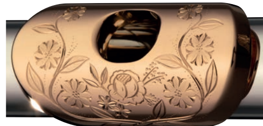
Gravur Typ C