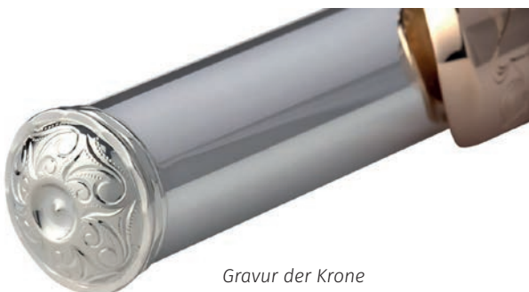
Gravur der Krone