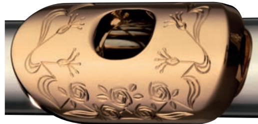
Gravur Typ B