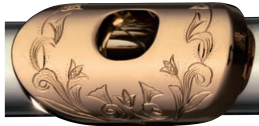
Gravur Typ A