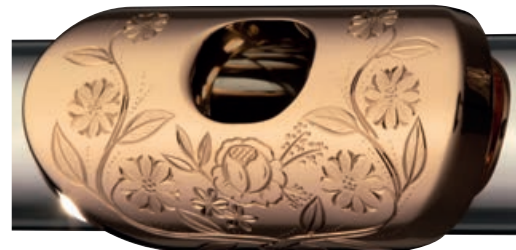
Gravur Typ C