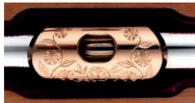
Gravur Typ C